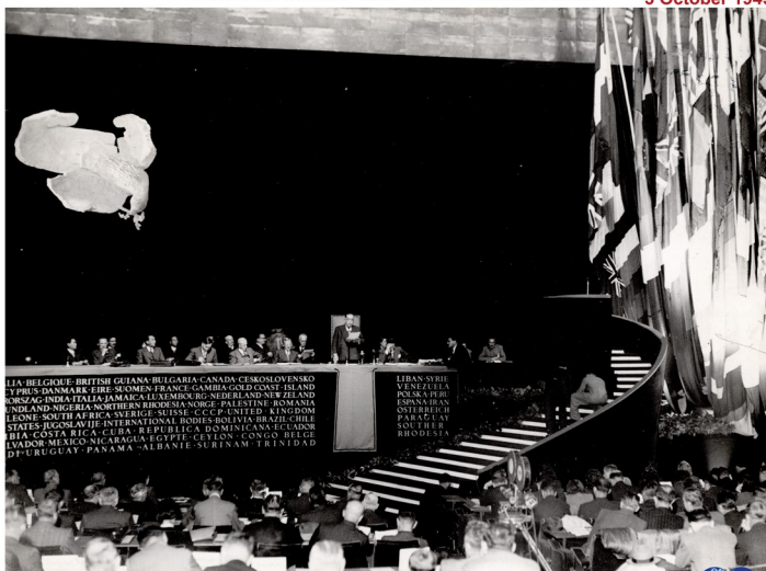
From right to left :Giuseppe di Vittorio (Italy), Louis Sallant (France), Walter Citrine (Great Britain), Phillip Murray (USA) and M. Tarasov (USSR). Standing in the centre is Vicento Lombardo Toledano (Mexico)

Hue, cuasi un sieglo dimpués, la crisi ecolochica se fa present en los conflictos politicos, sindicals y socials y las buegas biofisicas d'ó planeta son cada vez mas caboliosas. Isto conleva que lo sistema capitalista y la suya insaciable necesitat d'acumulación de capital, cismie y empente conflictos per lo control d'os recursos naturals entre los grands actors d'ó mundo, per lo control d'os recursos naturals. Donald Trump no ye varrenau ni guaire menos, ye chugando lo papel que le pertoca cuan a lo capital se l'estorba la suya primer opción. Pero no cal trafucar-se, la extrema dreita representada per los Trump, Meloni, Milei, Abascal u Orban, u la dreita extrema representada per